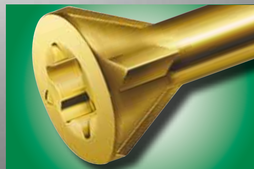
Senkkopf mit Fräsrippen